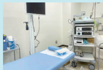
胃内視鏡(胃カメラ)